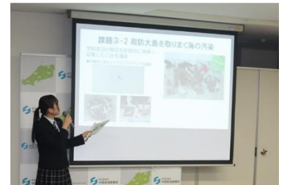
過去の受賞者プレゼンの様子