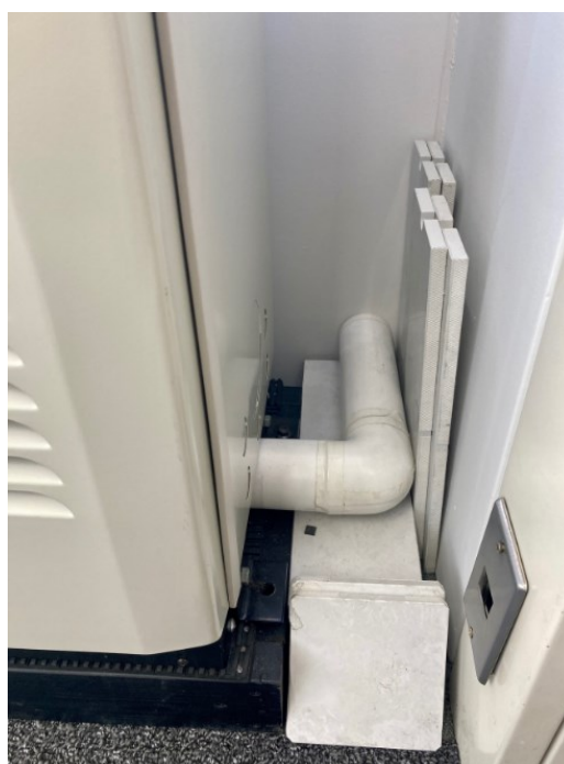
既設空調設備（室外機・配管）