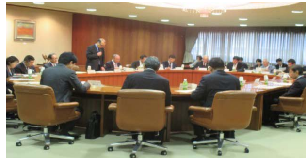
ひろしまヘルスケア推進ネットワーク設立総会