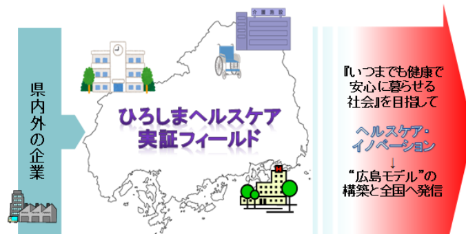
ひろしまヘルスケア実証フィールド イメージ図