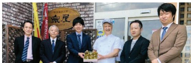
早いタイミングで相談したことで納得のいく後継者選びが可能に