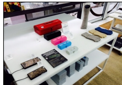
過去選定商品展示の様子