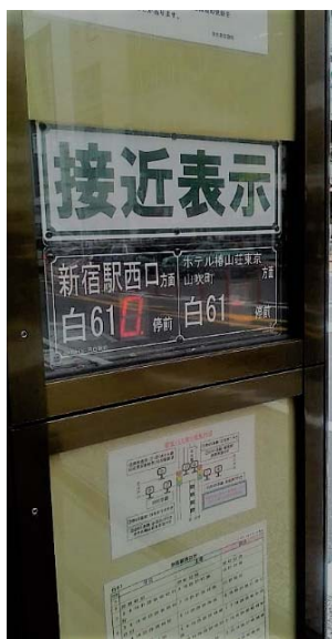
(写真2) 東京で見かけたバスストップのバス接近表示板 (新宿駅西口行の都バス白61) は直前のバス停を出発したことがわかる)

これまで主要メーカーの多くは高額な車載専用機を作ってきました。そのため車両への専用取り付け装置が必要で、載せ替えの自由度も損なわれ、高価でした。