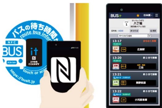
(写真5) 新型のBUSitバスロケーションシステムでのバス到着時刻表示方式。(中央の「it」のところスマートフォンやタブレット、パソコンをかざすとバスの到着時間が読み取れる)