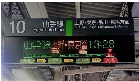
(写真1) 東京の駅ホームで見かけた電車到着予定表示

訳もわからず待たされるのは、嫌なものです。いつからか電車が前の駅を出たとか、あと数分でホームに到着するといった電子表示が出るようになりました。(写真1)