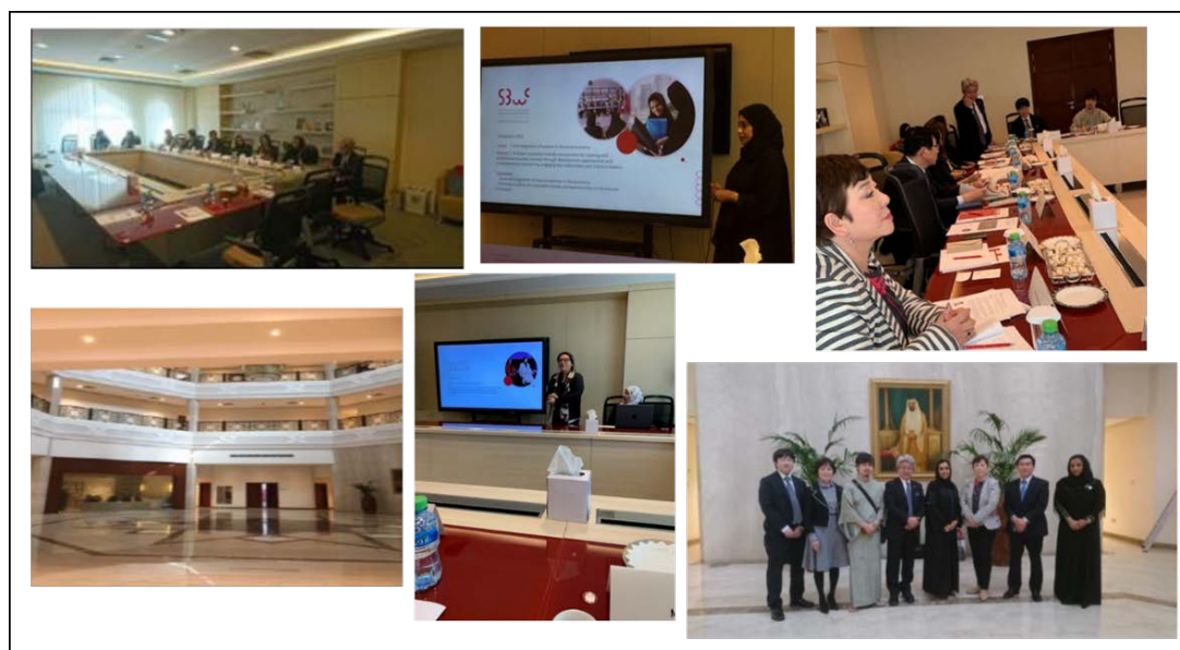
ビジネスウーマンズカウンシルの施設内や会議などの様子

日本に対しては、会社設立、投資家の UAE に対する投資、ファイナンスに関して日本の女性経営者と UAE の女性経営者との連携、また UAE のことを知っていただくためのワークショップの開催、シャルジャ女性経営者会議へ日本の企業が入ることも可能であり、スマホのアプリでの情報提供も行っている。