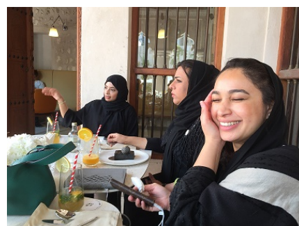
UAE の女性のメイクアップの様子

また、現在日本からほとんどスキンケア、サプリメント等の商品が入っておらず、EU の商品が最も多く、近年アジアからは、韓国の商品が多く入っている。