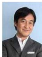
夏野 剛氏 慶應義塾大学大学院 政策・メディア研究科 特別招聘教授