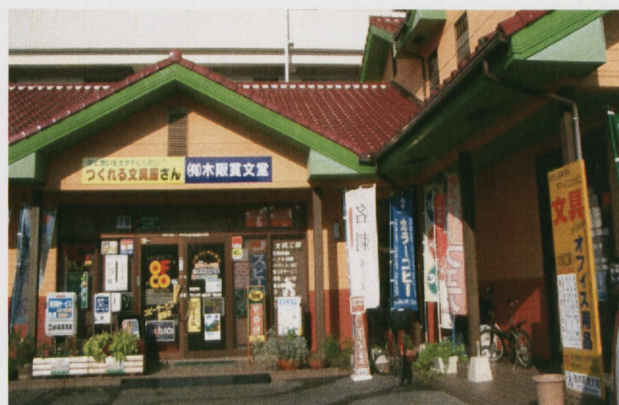
「つくれる文具屋さん」を目指す中央店

■ 少量からの封筒・のし紙・伝票等のスピード軽印刷、オリジナルシールや個性的な名刺の制作などにも取り組み、町の「つくれる文具屋さん」を目指して営業展開している。また、最近流行している塗り絵の大人向け体験教室を開催している。