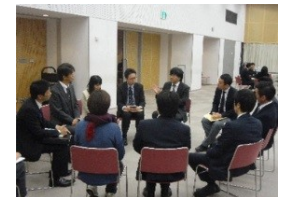
分科会でのセミナー