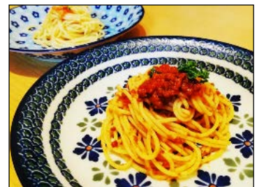
【広島牛の絶品ボロネーゼ】