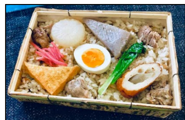
【府中味噌おでんごはん】