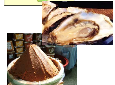
【広島県の地域産業資源】