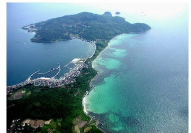
むかつくほんとう

自然豊かで、風光明媚な山口県長門市油谷地区に存在する地域産業資源「油谷湾」「向津具半島」などを活用し、ホテル楊貴館を起点に、「むかつく半島ウェルネスリゾート」を統一コンセプトとして、忙しい日々を過ごす現代人の体の疲れを癒し、精神的に安定させ、さらに力をチャージすることができる着地型観光商品を開発し、販路開拓に取り組む。