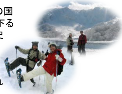
【雪上スノーシューハイキング による聖地巡り】