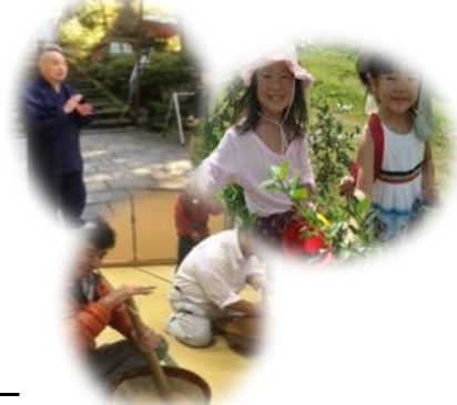
【歴史や食の恵みを体験できる エコトレッキング】