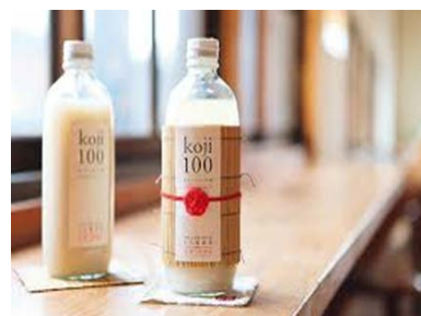
【老舗酒蔵と開発した甘酒】