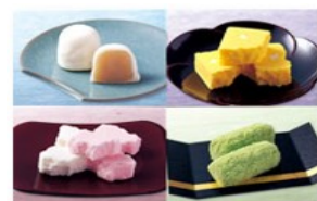
【不昧公ゆかりの銘菓】

平成30年は、松平不昧公没後200年という記念の年で、「松平不昧公200年祭」記念事業として「茶の湯文化薫る」特色ある観光地として、さらなるブランディングに取り組み、本事業により事業者の商品開発や販路拡大等を支援し、地域経済の活性化を図る。