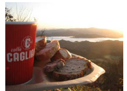
【地元こだわりの朝ごはん】