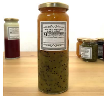
【季節の手作りジャム】

ブランド統一基準に基づいた商品を選定し、当社の開発ノウハウ、情報に基づいて、手土産等に最適な商品としてブラッシュアップすることで競合品との差別化が可能となる。