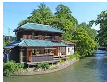
【町屋を改修した水辺のカフェ】

JR西日本とも連携することで、JR西日本管内各駅での販売を開始し、全国の高級食品専門店等へも販路を拡大する。