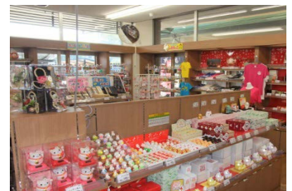
【グループ会社のお土産売り場】