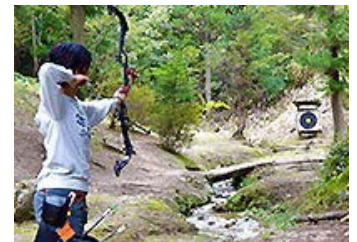
【中国四国地方で唯一のフィールドアーチェリー場】

広島県廿日市市の地域産業資源「フィールドアクティビティ」と、その他の観光関連地域資源を活かし、地域内の旅行事業者と宿泊事業者が連携し、沿岸部と山間部を結ぶ着地型観光ツアーを開発し、事業展開に取り組む。宮島を訪れる外国人観光客には新たな観光資源を提案し、国内向けには宮島と一緒に楽しめるフィールドアクティビティ等を提案し、新たな顧客の獲得を図る。