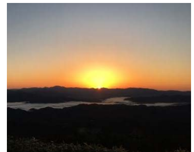
【三瓶山山頂の日の出】

そこで、リフトを特別に早朝より運行し、三瓶山山頂で日の出を見ながら、朝ごはんを提供する等の新たな着地型観光商品を開発し、販路開拓に取り組む。