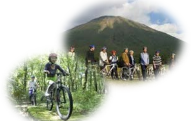
【国立公園大山での ダウンヒルサイクリング】

大山町の支援を得ながら、鳥取県西部商工会産業支援センターや(一社)山陰インバウンド機構等との連携、協力関係を構築し、「大山開山1300年エコツーリズム」のブランディングを図る。