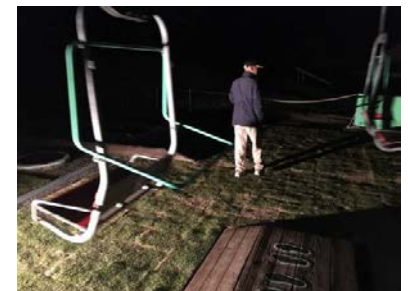
【特別運行するリフト】

本商品は、参加者の多くが普段見られない景色に感動し、参加しなければ、感じられない生の体感や他人へ伝えたいような感動を提供できる着地型観光商品である。