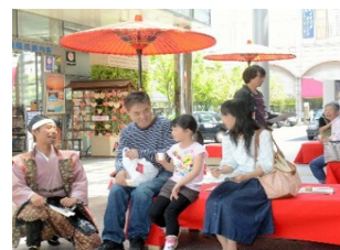
【城下町のおもてなし】