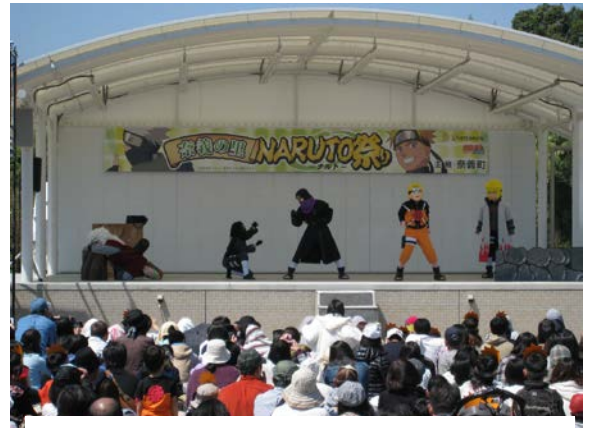
キャラクターショー

ナルトの作者の岸本斉史さんは、岡山県奈義町の出身だそうです。GWを利用して津山市に行く用事があったので、ちょっと奈義町に寄り道してみました。なにやら人が大勢集まっていたので、覗いてみると、テレビアニメの声優さんたちのトークショーやキャラクターショーをやっているではありませんか。晴天に恵まれ、多くの人出で賑わっていました(参加者は約 5000 名)。臨時駐車場には、関西方面など他府県ナンバーも多くみられました。地元ならではの食材を扱った屋台テントを見て回るのも楽しく、よく冷えた、地域資源の黒豆「作州黒」を使用した「黒々茶」で渴いた喉を潤しました。