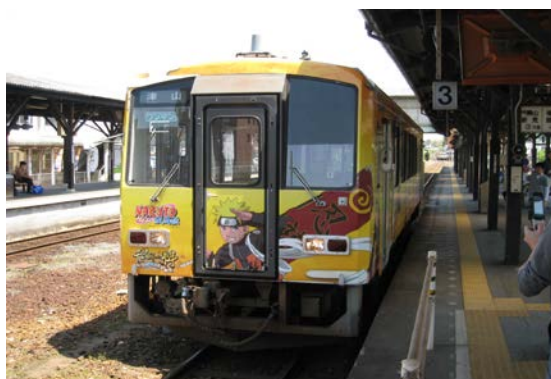
到着したナルト列車 (JR 姫新線、津山駅)

ホームには「撮り鉄」と思われる重装備の方から小さなお子さんまで、多くのファンが集まり、さかんにシャッターを押していました。