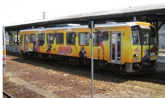
ナルトの影分身がラッピングされています。