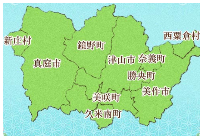
「美作国」は現在の岡山県北の10市町村とほぼ同じ地域